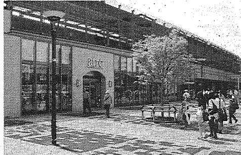
マンション開発で新たな商業需要 浦和駅周辺

路線価は主要な道路に面した標準的な宅地の1平方メートルの評価額。公示地価の8割を目安に決定される。