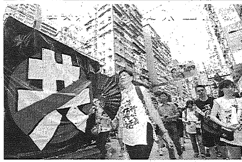
香港中心部で行われた親民主派のデモ行進。左は中国共産党に反対する旗(1日共同)