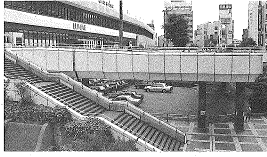
25年連続で県内最高路線価となった大宮駅西口駅前ロータリー付近(さいたま市大宮区)